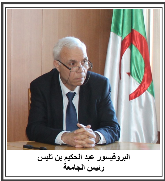
البروفيسور عبد الحكيم بن تليس رئيس الجامعة

أجرى البروفيسور عبد الحكيم بن تليس دراساته الجامعية بالمعهد الوطني للمحروقات ببومرداس، حاليا، كلية المحروقات و الكيمياء، أين حصل على شهادة مهندس دولة في الجيوفيزياء سنة 1977.